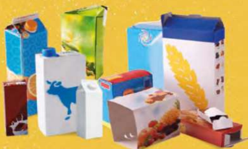
TOUTES LES CARTONNETTES ET BRIQUES ALIMENTAIRES

À DÉPOSER DANS LES COLONNES JAUNES DE TRI