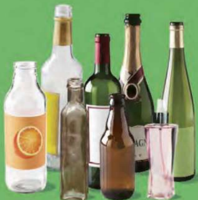
BOUTEILLES ET FLACONS EN VERRE