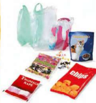
TOUS LES FILMS, SACS ET SACHETS EN PLASTIQUE