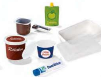
TOUS LES POTS, BOÎTES ET TUBES EN PLASTIQUE