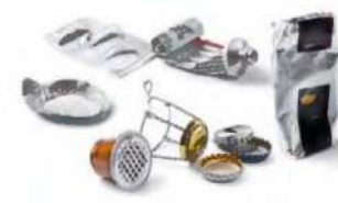
TOUS LES PETITS EMBALLAGES EN MÉTAL