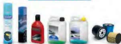
DÉCHETS DES PRODUITS D'ENTRETIEN DE VÉHICULE