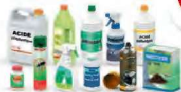
DÉCHETS DES PRODUITS D'ENTRETIEN DE LA MAISON