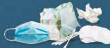
PRODUITS D'HYGIÈNE OU SOUILLÉS