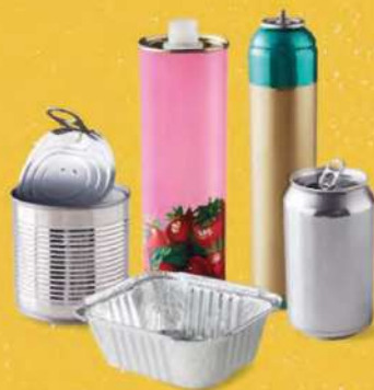
TOUS LES EMBALLAGES EN MÉTAL