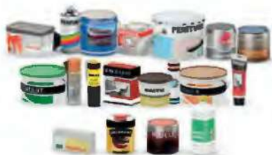
DÉCHETS DES PRODUITS DE BRICOLAGE ET DÉCORATION

Les déchets chimiques ne vont pas à la poubelle, ni dans les canalisations. Ils doivent être apportés en déchèterie dans leurs emballages d'origine si possible et ne doivent en aucun cas être jetés dans votre poubelle !