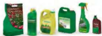
DÉCHETS DES PRODUITS DU JARDINAGE