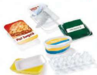
TOUTES LES BARQUETTES EN PLASTIQUE