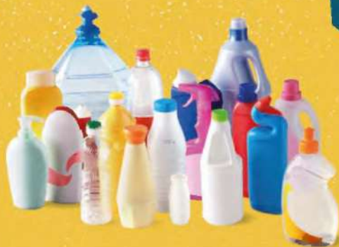
TOUTES LES BOUTEILLES ET TOUS LES FLACONS EN PLASTIQUE